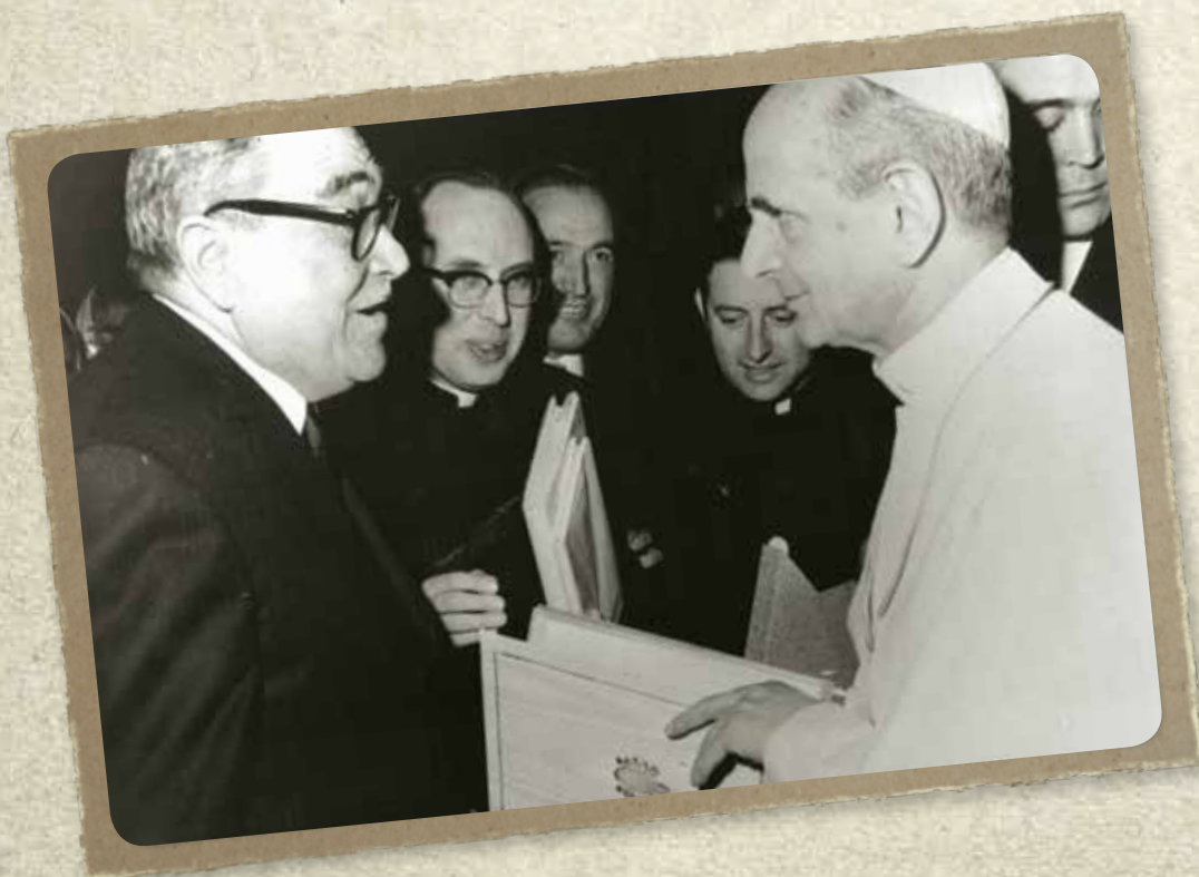
Nella foto Papa Paolo VI incontra i rappresentanti della Cassa Rurale